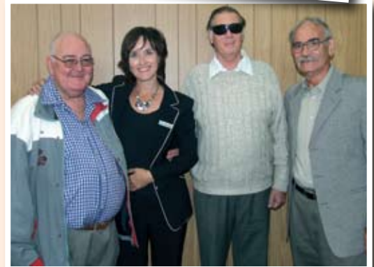
NG Stellenberg Senior Klub.